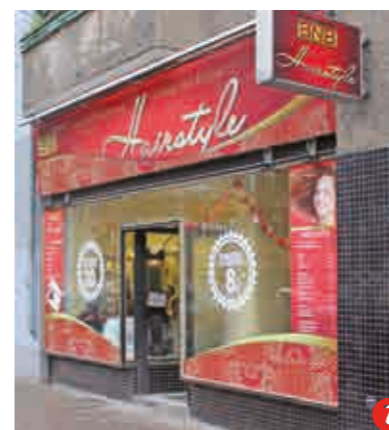
Salon Hairstyle, Perleberger Straße