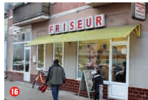
Coiffeur Baron, Stromstraße

Schnell war unser kleines Heft über Läden, Werkstätten und Restaurants in Moabit-Ost vergriffen. Im Januar ist die 2. Auflage in Geschäften und im Quartiersbüro kostenlos zu haben.