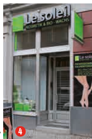
Gut für die Haut: Kosmetik-Studio „Le soleil“, Lübecker Str.

lichkeit, Service und angemessenen Preisen die Kundschaft zu halten. Die Frisöre waren schon immer Treffpunkte und Orte für Neuigkeiten. Deshalb sind auch fast alle bereit, immer Ihre druckfrische Quartierszeitung "21° Ost" auszuliegen – danke dafür. Haben wir Ihren Lieblingsfrisör vergessen? Bitte melden Sie sich bei uns.