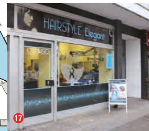
Schnell und günstig: Hairstyle Elegant, Turmstraße