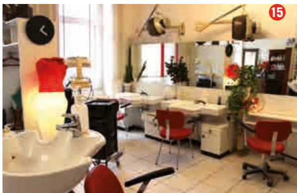
Weihnachtlich geschmückt: Salon MoaHair in der Stromstraße