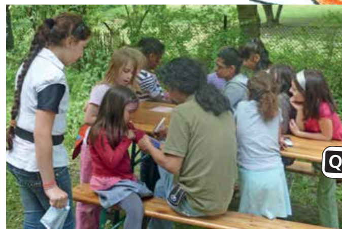
Malen, basteln, auf Kisten klettern, Kaninchen füttern und am Lagerfeuer sitzen – das bietet der Moabiter Kinderhof in den Sommerferien. Von Montag bis Freitag ist ab mittags geöffnet. Seydlitzstr. 14