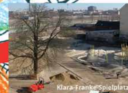
Klara-Franke-Spielplatz, Frühjahr 2013