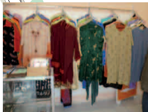
Original pakistanische Kleidung stellt die Schneiderin in der Stromstraße her.