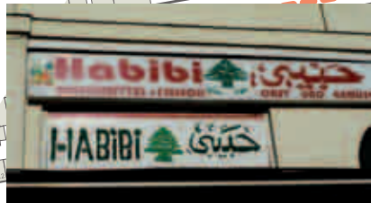
Leckeres aus dem Orient findet man bei Habibi an der Ecke Rathenower.