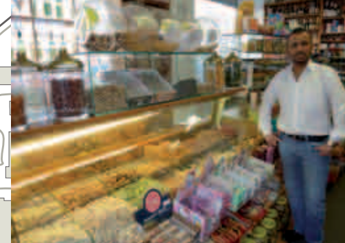
Nüsse und Trockenobst bietet der kleine Laden Kuruyemis in der Stromstraße.

GSZM: Gesundheitszentrum ehemaliges Krankenhaus Moabit