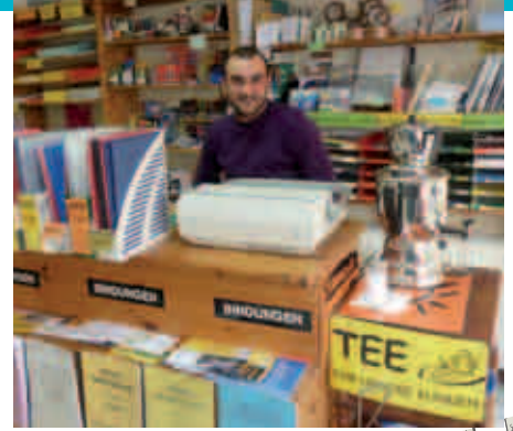
Im Copy-Shop ist der Samowar immer heiß und Kiez-Klatsch erfährt man am besten hier.

Hier eine kleine Auswahl an Geschäften, Restaurants und Begegnungsräumen verschiedener Kulturen.