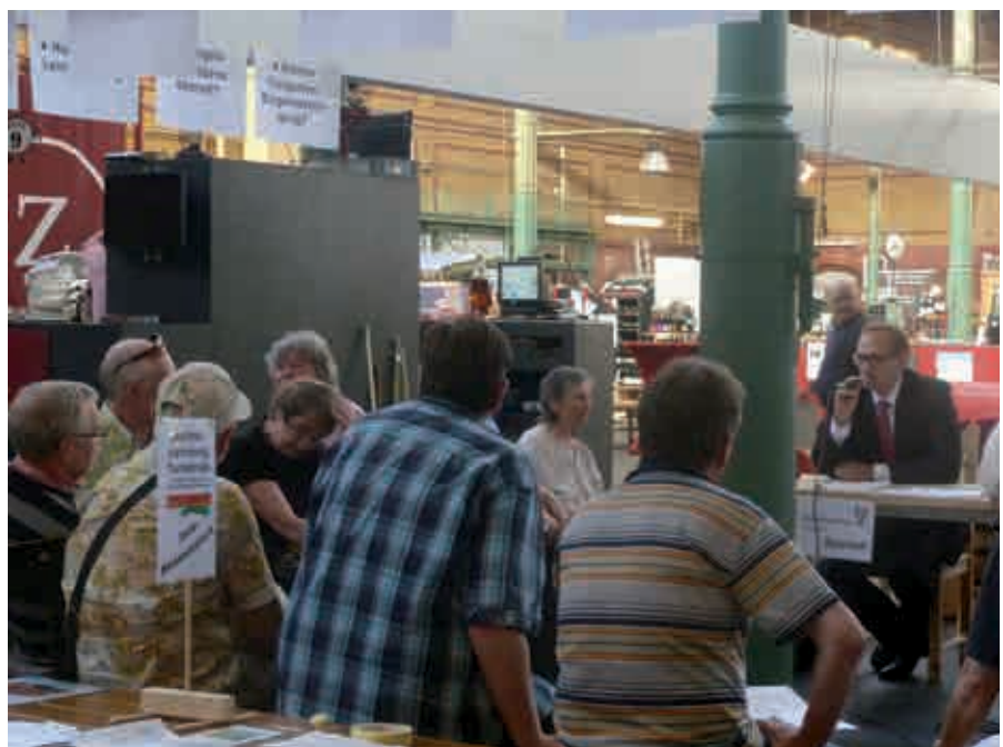
Hier kommen die Probleme von Moabit auf den Tisch: immer mittwochs, 17 Uhr Zunfthalle