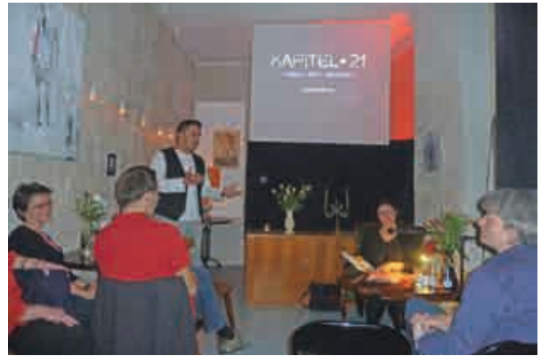
Die Veranstaltungsreihe „Wir in Moabit, 'mal anders“ begann mit einem Theaterstück in der Kulturfabrik am 3. Mai. Die Tadschikische Botschaft lud in die Perleberger Straße am 31. Mai zu einem Abend ein (Foto oben links.) Im Juni war dann die bekannte Autorin Hatice Akyün zu einer Lesung im Café Kapitel 21 zu Gast. (Foto oben rechts.)