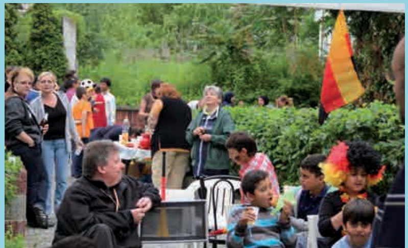
Gemeinsam jubeln bei der Fußball-EM, Pritzwalker Straße