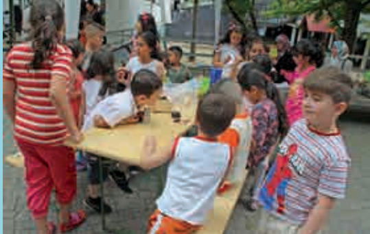
Hoffest in der Lehrter Straße am 19. Juni