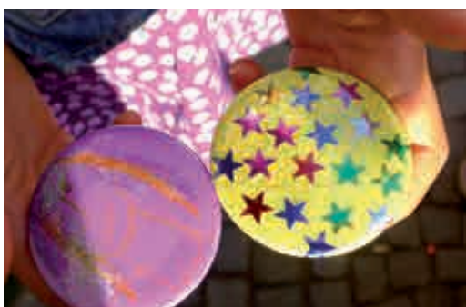
Solche schönen farbigen Buttons können Kinder im Kiez nun selbst basteln