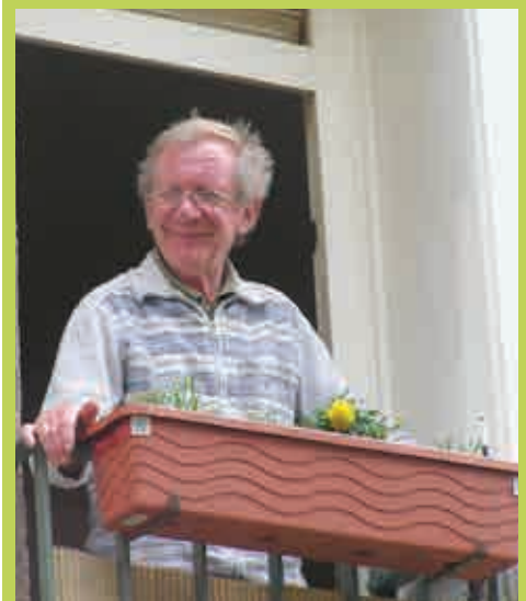
Freut sich wie Bolle: ein Bewohner des Obdachlosenheims mit seinem neuen Blumenkasten – bepflanzt im Rahmen eines Quartiersprojektes – mit dem Ziel der grauen Lübecker einen Farbtupfer zu verleihen.

sehr voll hier. Insgesamt 8 Stände mit vielen Angeboten gab es hier, wie z.B. Kuchen und Spiele, man konnte sich schminken lassen und es gab Vieles zu gewinnen. Wenn man wollte, konnte man sich sein Fahrrad umsonst reparieren lassen. Die Atmosphäre ist hier sehr schön. Viele Menschen kamen auch aus anderen Kiezen. Es fand eine Putzaktion statt, mit etwa 40 Kindern und Erwachsenen. Durch das Fest konnten wir andere nette Nachbarn aus dem Kiez kennenlernen“.