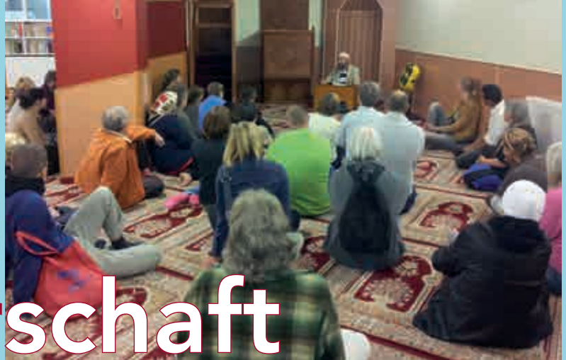
Fastenbrechen in der Moschee Stromstraße am 9. August