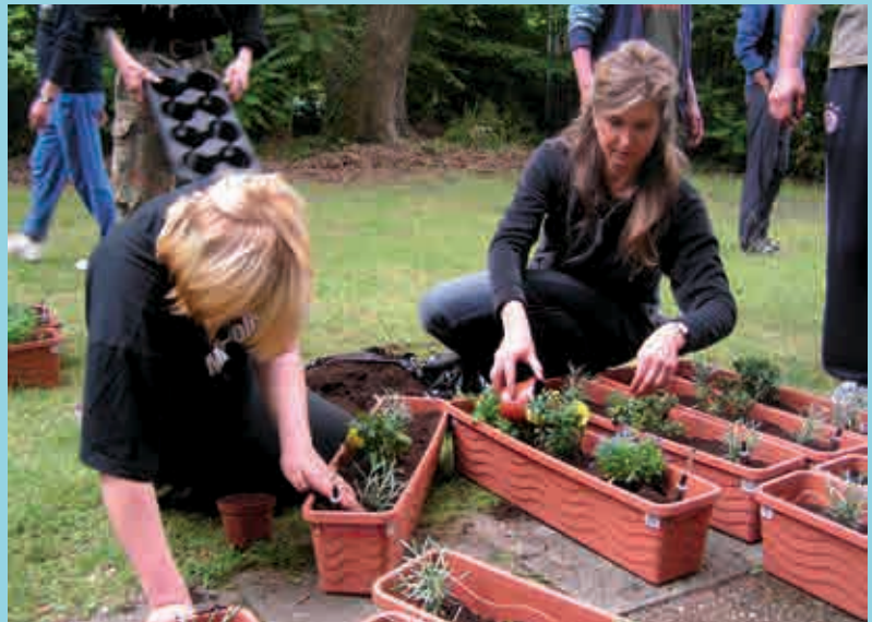
Bepflanzung von Balkonkästen für das Obdachlosenheim am 14. Juni